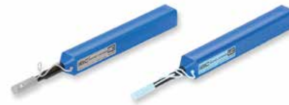
CLEANER-PORT-2.5 and CLEANER-PORT-LC